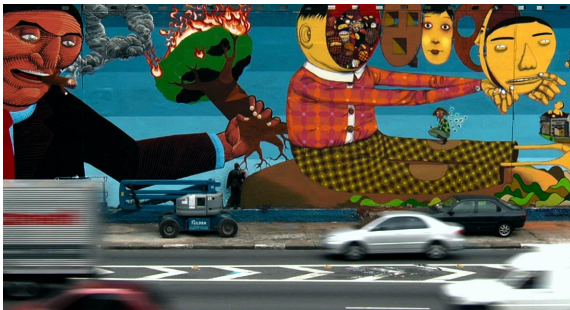
Ilustração 2: Detalhe da recuperação da mural na alça de acesso à Avenida 23 de maio.

poderes constituídos em julgar e interpretar as manifestações artísticas contemporâneas. Por conta da aprovação de uma lei conhecida como “ Cidade Limpa ”, funcionários- desinformados- da prefeitura de São Paulo apagaram um mural na alça de acesso à Avenida 23 de maio. Só depois de muita pressão por parte da mídia e organizações internacionais, foi que a prefeitura reconheceu o erro e autorizou à re-pintura do painel, sob financiamento privado.