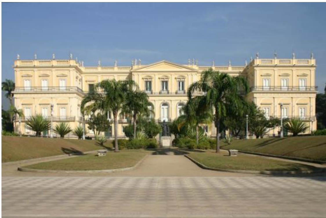
Ilustração 4: Fachada do Museu Nacional.

Esses exemplos, de um museu mantido pela iniciativa privada e outro pela pública, refletem bem o descaso que o campo cultural e artístico se encontra em nosso país. No ano de 2011, o IBRAM- Instituto Brasileiro de Museus publicou o Guia dos Museus Brasileiros , uma espécie de lista de registro, organizada a partir de 2006 com a criação do Cadastro Nacional de Museus . Entre seus conteúdos, distribuídos entre oito tópicos, encontra-se uma tarja amarela que faz referência aos Museus extintos, incorporados e renomeados . Nesse trecho da publicação, que poderia ser chamado de Capítulo VI, visto que é o sexto tópico a ser divulgado encontramos os dados cadastrais e situação dos museus, que por uma causa ou outra tiveram suas portas fechadas para visitação durante o período dos cinco anos de pesquisa. Segundo consta no documento,