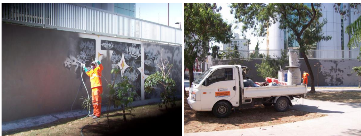
Ilustração 1: Funcionário da prefeitura cobrindo mural de Graffiti.

Arte que chegou a um determinado ponto onde sua complexidade de interpretação, ou confunde completamente ou exclui os observadores simplistas do seu circuito. Geralmente esses observadores ainda mantêm um padrão estético forte, ligado a narrativa mestra da representação mimética . A frase de um dos grafiteiros Os Gêmeos: “- Aquilo que não se vê não exclui o que se pode ver ”, mencionada em trecho do filme Cidade Cinza (MESQUITA; VALIENGO, 2013), exemplifica nossa problemática sobre o interesse pelo público pela arte contemporânea, enquanto o filme em si traz importantes contribuições sobre a ação política, outras questões circundam o espectador.