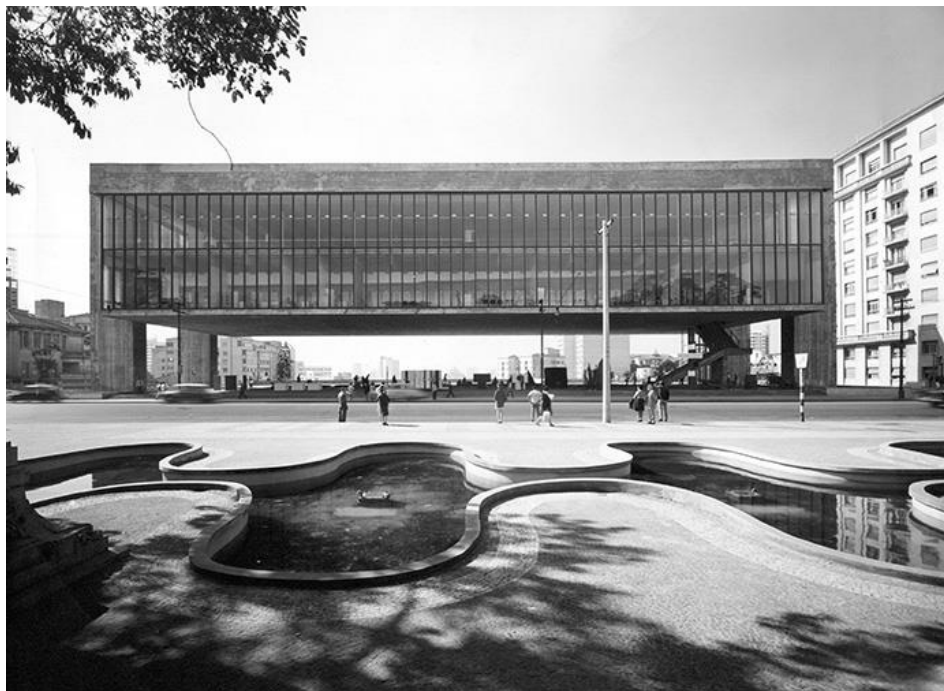
Ilustração 3: Vista do MASP.

Recentemente, outra instituição passou por uma situação parecida. O Museu Nacional mantido pela UFRJ- Universidade Federal do Rio de Janeiro teve suas portas fechadas ao público, a alegação é que faltava verba para pagamento de serviços terceirizados, nas áreas de limpeza e segurança. O fato de 20% do orçamento anual do museu não ter sido liberado pelo MEC para 2014, talvez explique a medida tomada pelos responsáveis em manter durante 14 dias o museu mais antigo do país sem acesso à visitação. Só depois de um pedido- atendido- de adiantamento da verba para 2015 é que a ordem se estabeleceu.